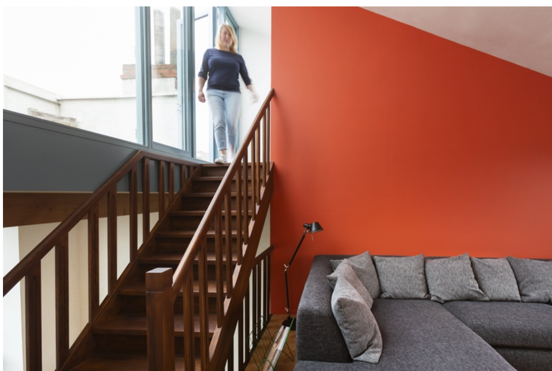
De knusse zitruimte, die aansluit bij het dakterras.