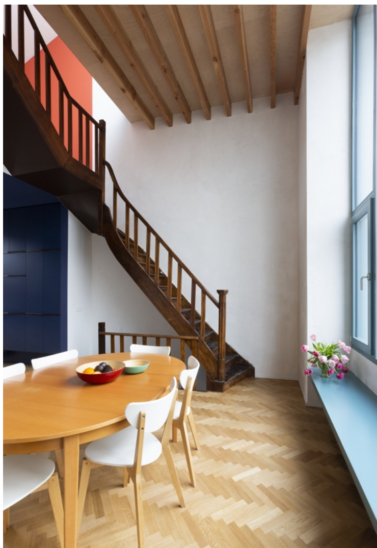
De eetplaats, centraal in huis.

Verder zijn er ook nog plannen voor een boekenkast/bureau-meubel, maar dat blijft budgetgevoelig nog even op de plank liggen. En voor de rest heeft dit huis heel weinig meubelen of aankleding nodig: de sprekende architectuur doet wat moet.