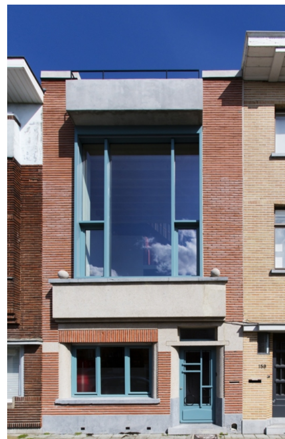
De gevel, met passende frisblauwe ramen.