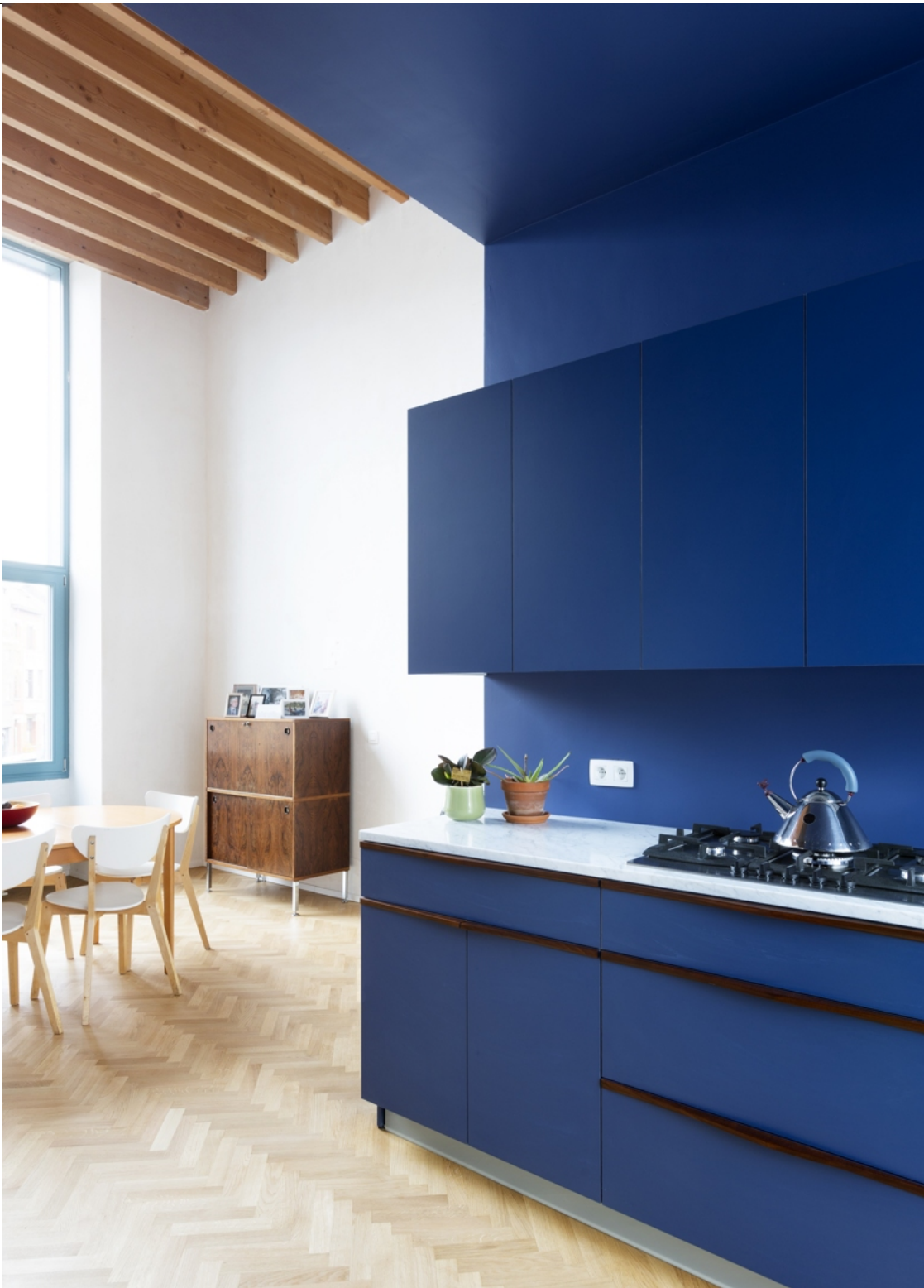
De keuken, op de eerste verdieping.